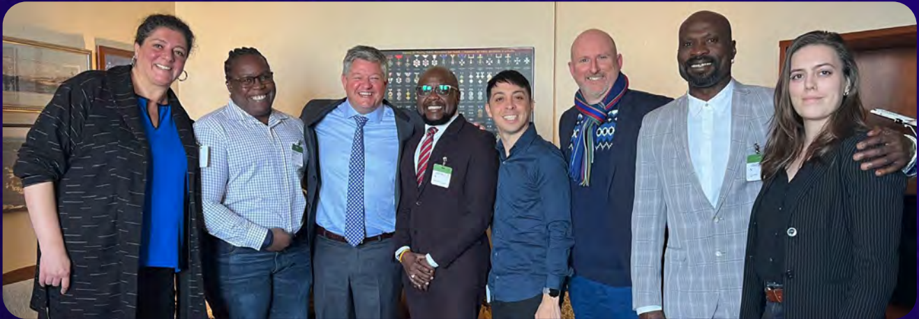
Les membres du Réseau Dignité et les invités internationaux avec Scott Aitchison, député conservateur de Perry Sound-Muskoka