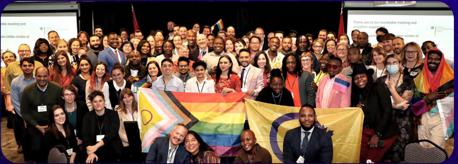
Les participants à la table ronde