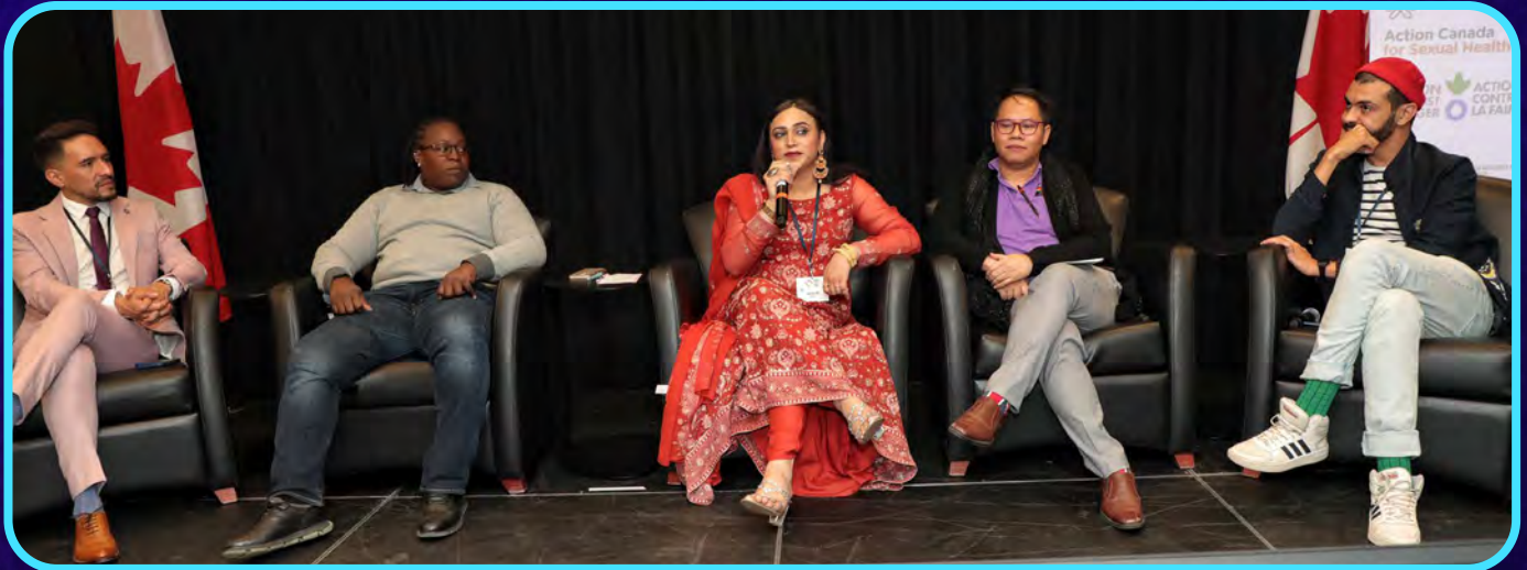
Panel du Conseil consultatif international du RDC, comprenant des membres de l'Équateur, Sainte-Lucie, du Pakistan, du Laos et du Maroc.