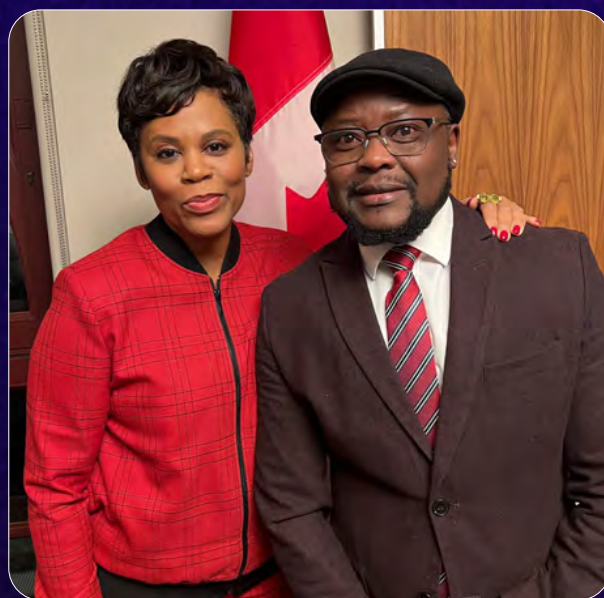
L'Honorable Marci Ien, Ministre des Femmes et de l'Égalité des genres et de la Jeunesse, avec Pepe Onzeima, de Sexual Minorities Uganda and Sexual Minorities Uganda et du Conseil consultatif mondial du Réseau Dignité.Board