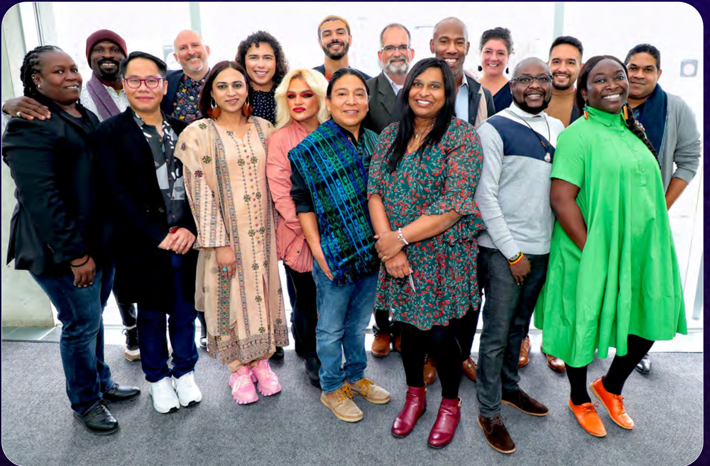
Membres du conseil d'administration et du conseil consultatif mondial du Réseau Dignité Canada