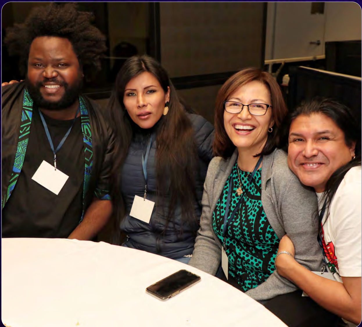
Participants du Cameroun, du Pérou et du Canada

Nous avons accueilli aux réunions des défenseurs des droits LGBTQ+ des pays suivants : Guatemala, Jamaïque, Mexique, Sainte-Lucie, Équateur, Pérou, Colombie, Argentine, Afrique du Sud, Mozambique, Kenya, Ouganda, Nigeria, Côte d'Ivoire, Maroc, Pays-Bas, Allemagne, Pakistan, Thaïlande et Laos.